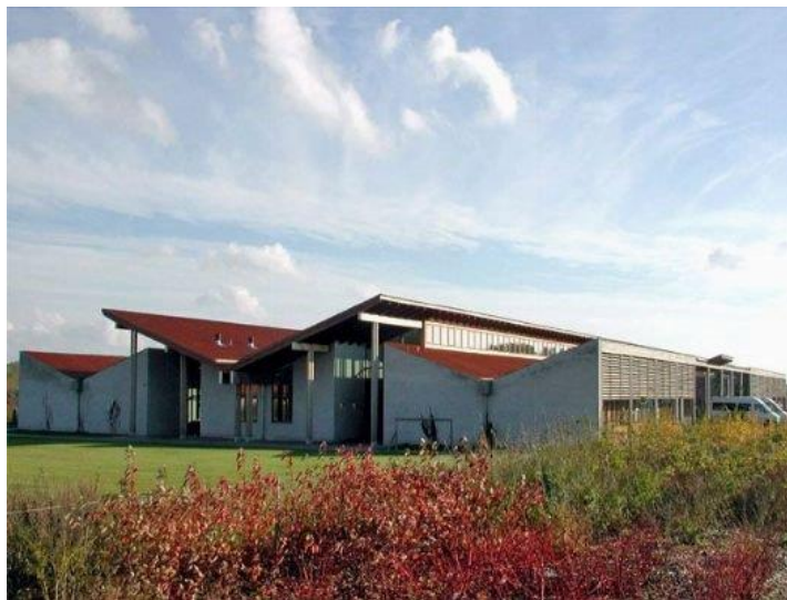
Kirkebækskolen i Vallensbæk

Altså, at de lærere og pædagoger, der er fællesansvarlige for en klasse, rejser ud og lærer sammen.