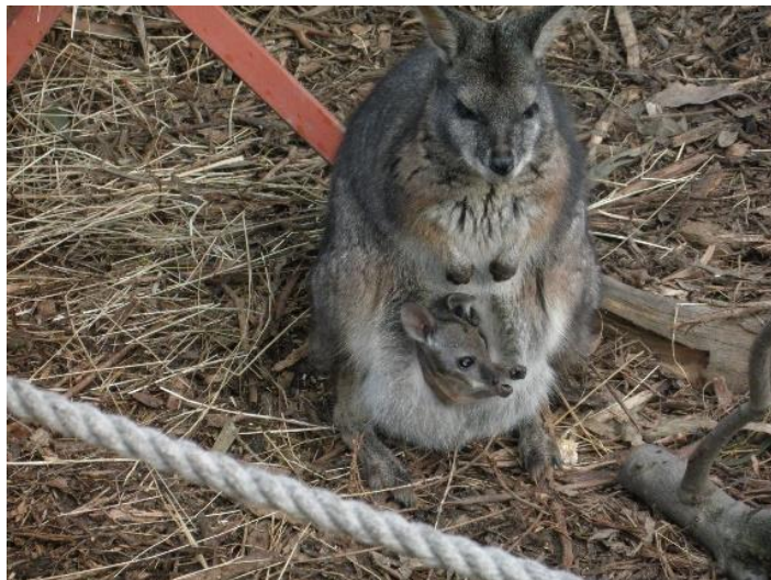
Mor og barn på australsk maner