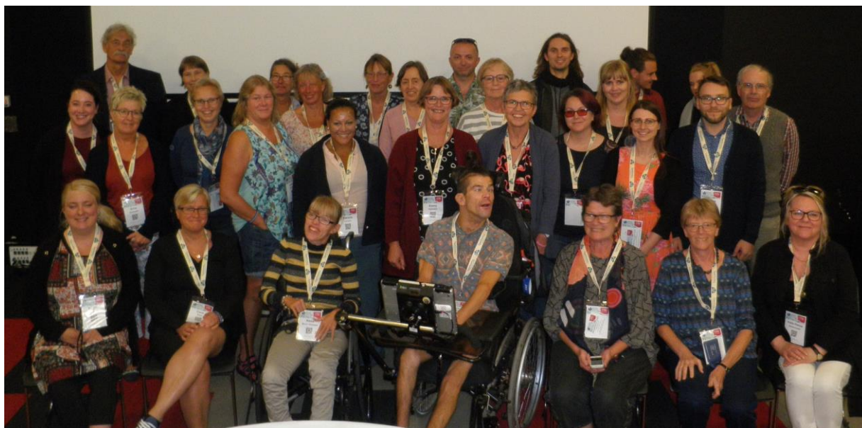
Fællesnordisk Chapter-meeting i Gold Coast, Australien